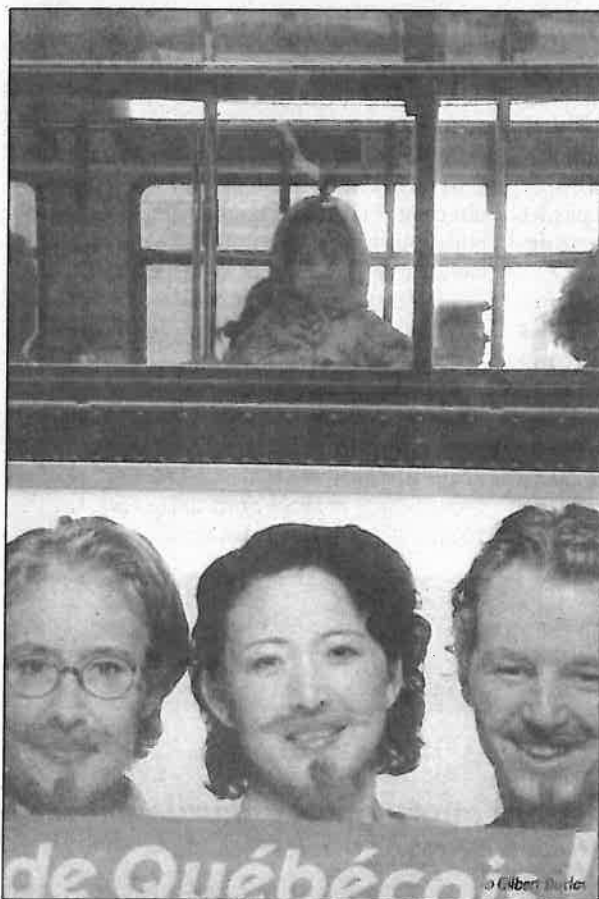
Autobus 55, Montréal, 1997.

En tout, 40 photos sont présentées. C'est la première fois qu'elles sont toutes réunies. Avant la Tohu, Montre-moi ce que